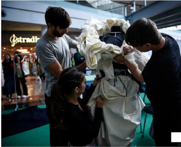
Tres participantes se afanan en dar forma a un vestido. Yoone Iturbalza

'Del desecho a la moda' plantea a nueve diseñadores el reto de crear con sacos, plásticos y retales